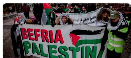
Palestinagrupperna syns på gator och torg.