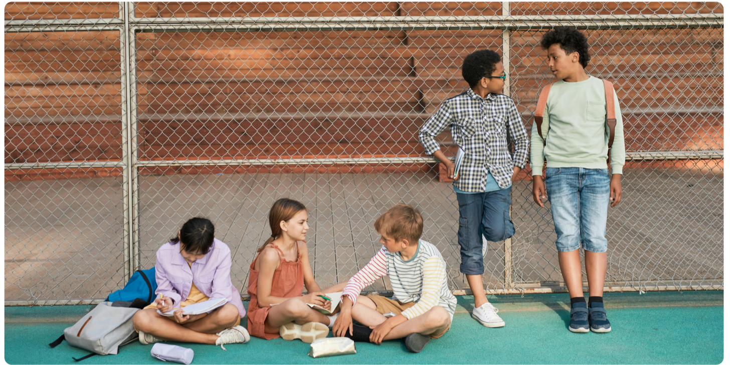
Vänsterpartiet Mölndal är kritiska mot marknadsexperiment och ineffektiva besparingar som drabbar de som går på våra skolor och tar del av vår omsorg.